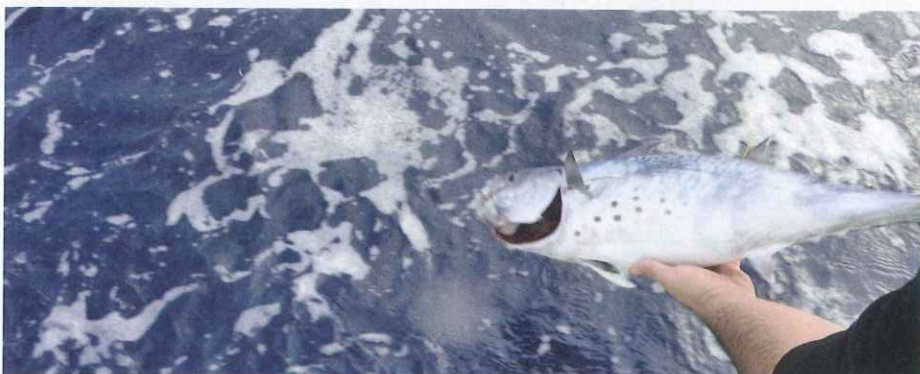
Esta bacoreta fue marcada en el transcurso del campeonato.

eventos, y se presentó el Maratón del Golfo de Valencia (42 horas) en la Marina Juan Carlos I; el Open Ciudad de Valencia y la Jornada de Colaboración Científica, todo ello organizado por el Real Club Náutico de Valencia con el apoyo de la APRRCV, al que fueron invitados todos los participantes como forma de compartir y convivir las mejores oportunidades de pesca.