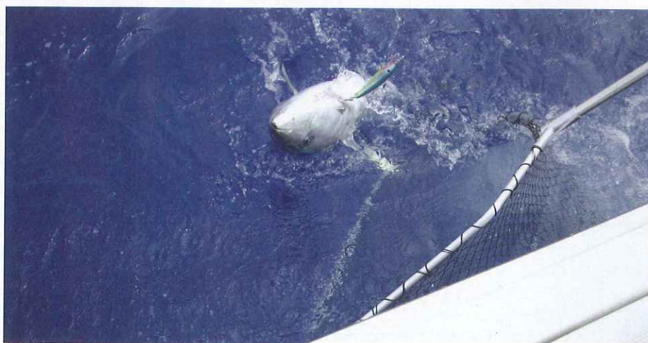
Las piezas se sacan del agua procurando causar el menor daño al animal.