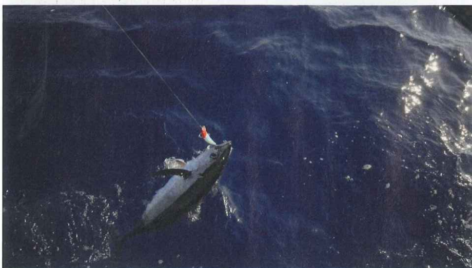
De momento el atún rojo muestra signos de recuperación; hay que seguir así.