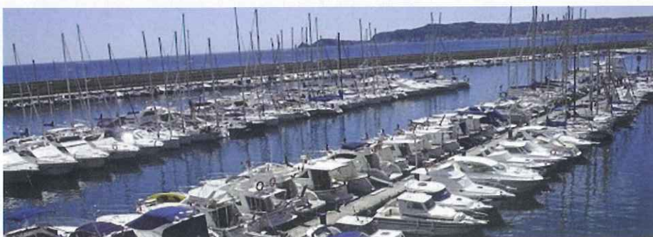
Vista parcial del puerto deportivo de Jávea, escenario de este gran campeonato.

El sábado a las siete en punto de la mañana ya estaban todas las embarcaciones en bocana, preparadas para la salida.