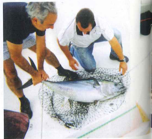
Los ganadores miden una de sus capturas.

La charla posterior en la terraza aportó imaginación y proyectos para compartir