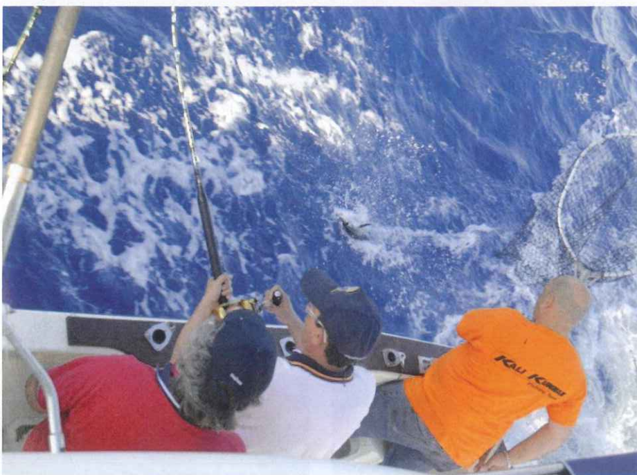
La prueba contó con una buena participación, y excelente organización.

que indicaban las tablas solunares, para ponerse a pescar rápidamente. Otros, quisieron llegar lo antes posible a la zona conocida por la "V", y subir hasta los cables (indicado en el Tuna Finder).