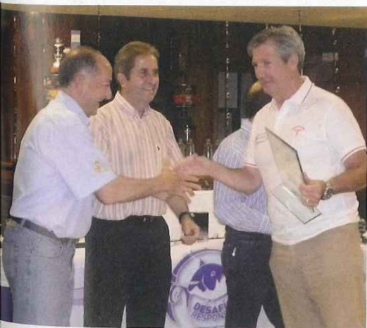
El ganador logró la inscripción para el Mundial IGFA de Cabo San Lucas.

Los equipos clasificados en cada uno de los concursos puntuables participarán en la final que se celebrará en Cabo San Lucas, siendo el mejor clasificado entre ellos el ganador del Desafío Responsable 2012. ■