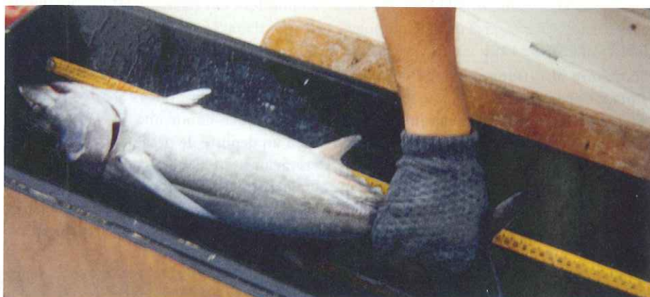
La medición de las piezas es fundamental en el Captura y suelta.