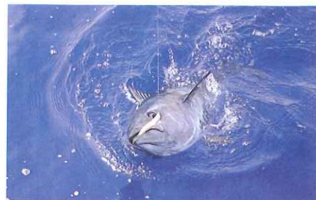
Algunos animales concedieron la satisfacción de un largo tiempo en su captura (y suelta).