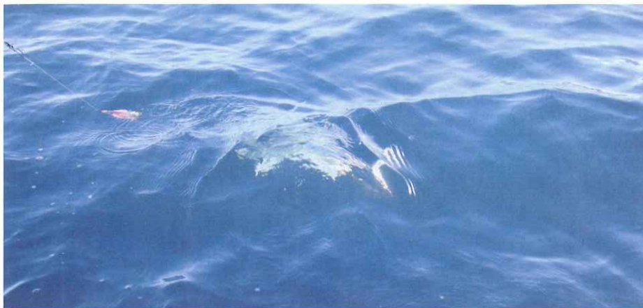
La captura y suelta fue aplicada a 33 capturas, y de ellas 12 fueron marcadas.